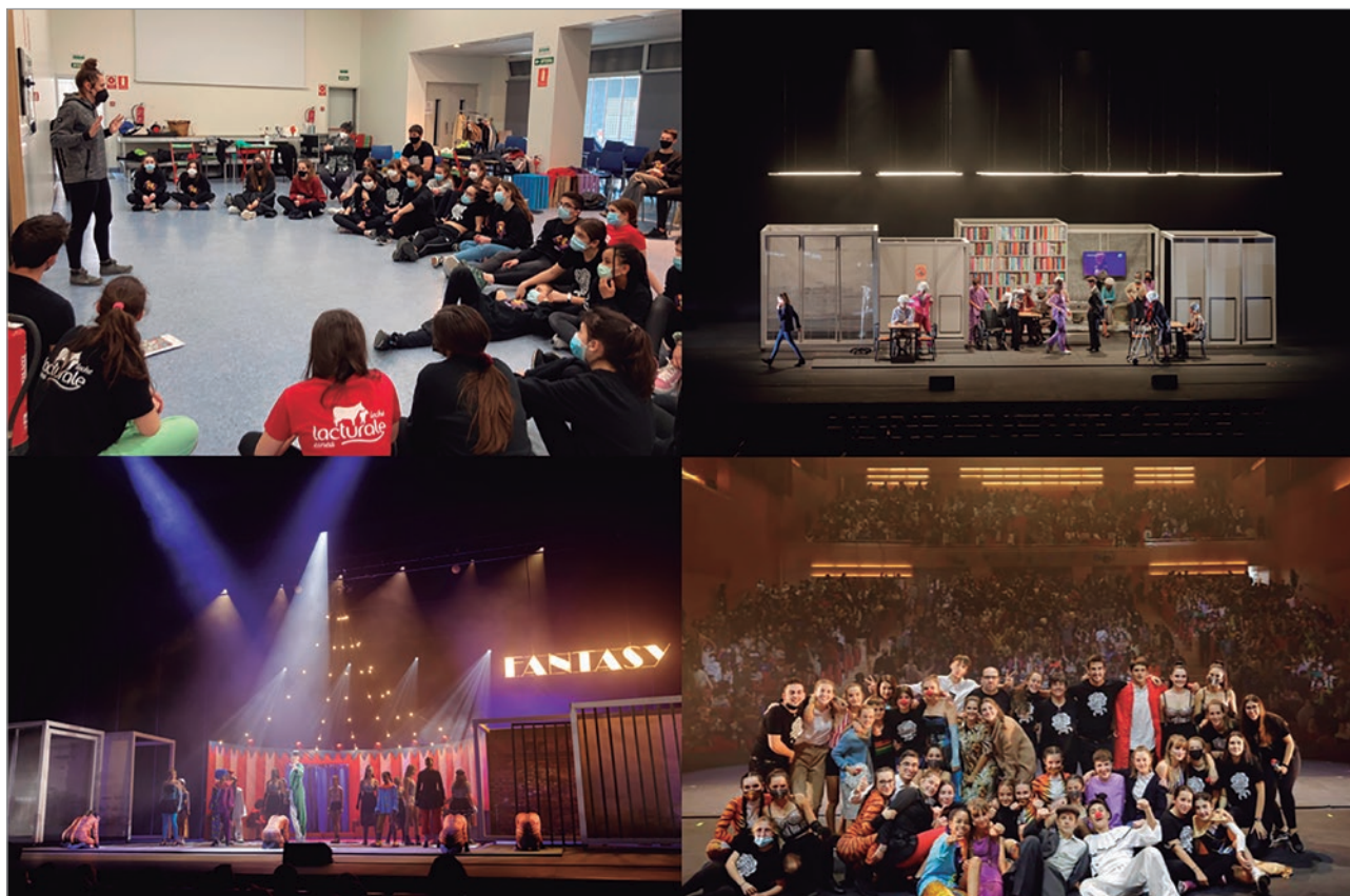
FIGURA 2. Reunión de grupo en la ikastola , escenas de la obra y foto de equipo tras una representación (autor: Mikel Legaristi).

En los proyectos de Jaso Musikala , durante el proceso de guionización se decide qué escenas se quieren transformar en números musicales, escogiéndose la música más adecuada y adaptando la letra a la métrica de la canción. En esta fase del guion se tienen en cuenta las diferentes habilidades que hay dentro del grupo y se crean subgrupos. Hay responsables de personajes (que lo escrito para cada personaje tenga coherencia con su forma de ser), responsables de redacción de textos, responsables del background de cada personaje, responsables de ortografía y gramática, e incluso un responsable de mantener una pizarra con el desarrollo de cada escena durante el proceso de escritura.