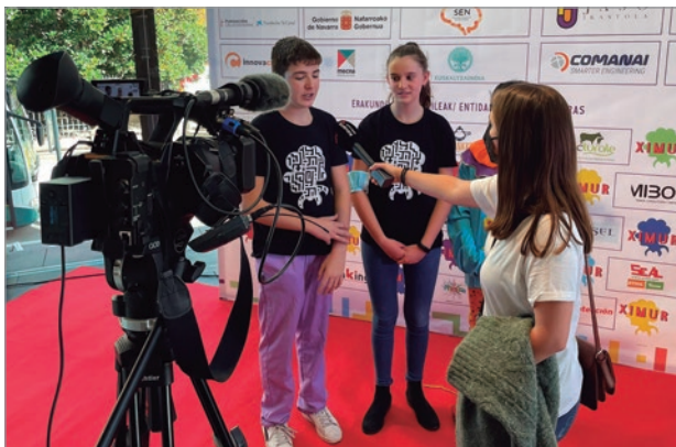
FIGURA 5. El equipo de comunicación de Ximur atendiendo a la prensa.

científica 18 (Figura 5). En este sentido, lo más destacado fue un reportaje que realizó el programa La aventura del saber , de la Corporación Radiotelevisión Española (RTVE) 19 , junto con una entrevista en directo a los directores del proyecto 20 . El equipo de este programa se desplazó durante cuatro días a Pamplona para vivir el día a día del grupo y los directores fueron invitados al plató de Madrid para contar la experiencia. Finalmente, el día del estreno el equipo volvió a desplazarse a Pamplona para grabar la obra.