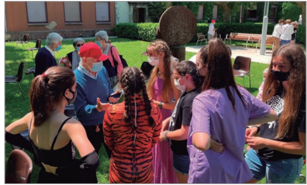
FIGURA 3. Parte de la troupe de Ximur departiendo con un residente de la Casa de Misericordia de Pamplona.

Este último apartado contiene el mensaje principal del musical: la dignidad de los enfermos de demencia. Se trata de un videoclip divulgado en redes sociales antes